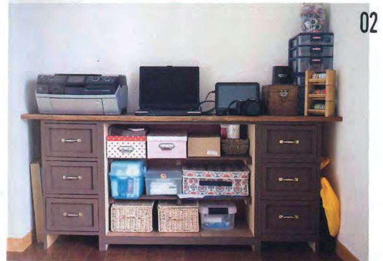
02_リビング奥の部屋に置かれた棚には幼稚園の先生を務めている奥さんが使う事務用品が置かれている。右側の箱はアンティークで、収納されているのは文具などの小物類。