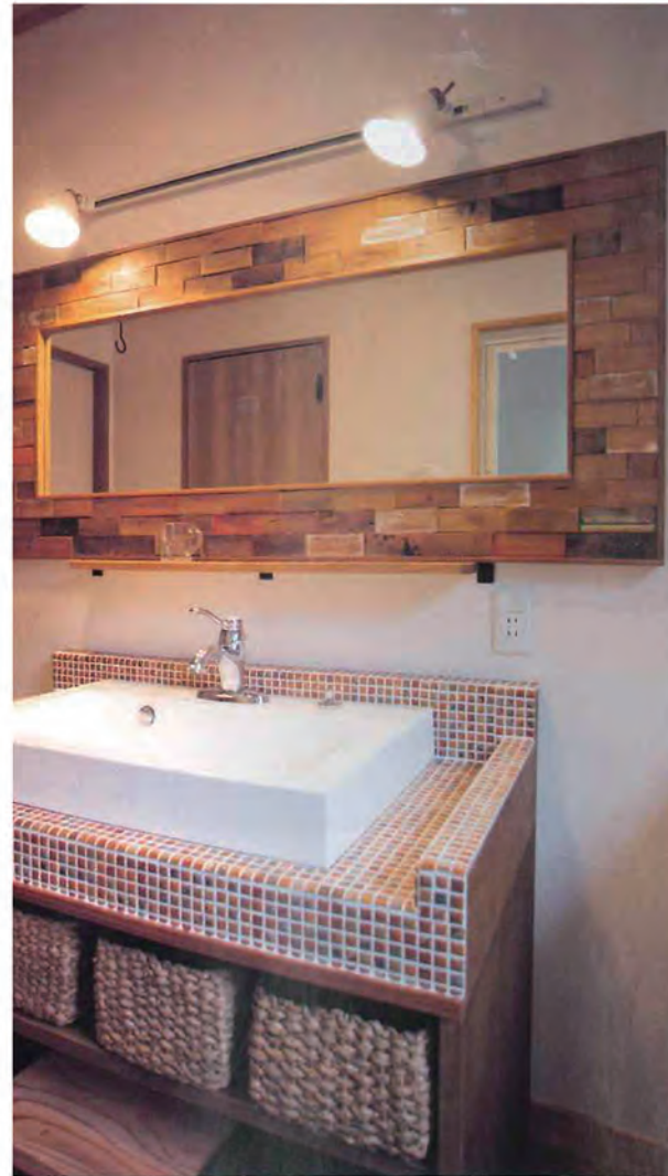
洗面台のタイルは、ウッド基調のインテリアとの相性を考えてアンティーク調のブラウンに。ミラーは既製品だが、姿見を横にして使うという発想がおもしろい。