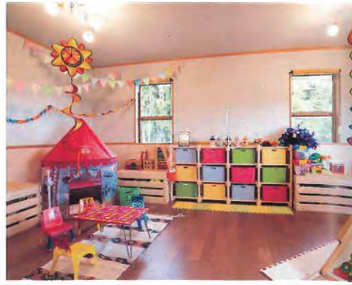
将来セハレトすることを想定した、広めの子ども部屋。カラフルな収納は市販のカラーボックスをD.I.Y.で作った木製の棚にしまったもの。左に見えるのは子ども用のテント。