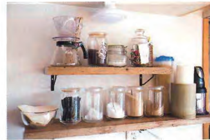
キッチンにもやはりD.I.Y.の棚が設けられている。並べられているのは「カリタ」のサーバーをはじめとしたコーヒー関連のグッズや調味料などで、ビンに移し替えたことで、見た目にもスマートな見せる収納。