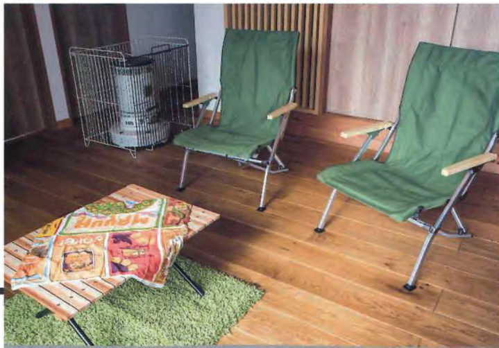
ローテーブルは杉の板で自作したもの。「ソファを置こうかとも思ったんですが、アウトドア感を強めたくてこれにしました」というのはくスノーピークのキャンプチェア。