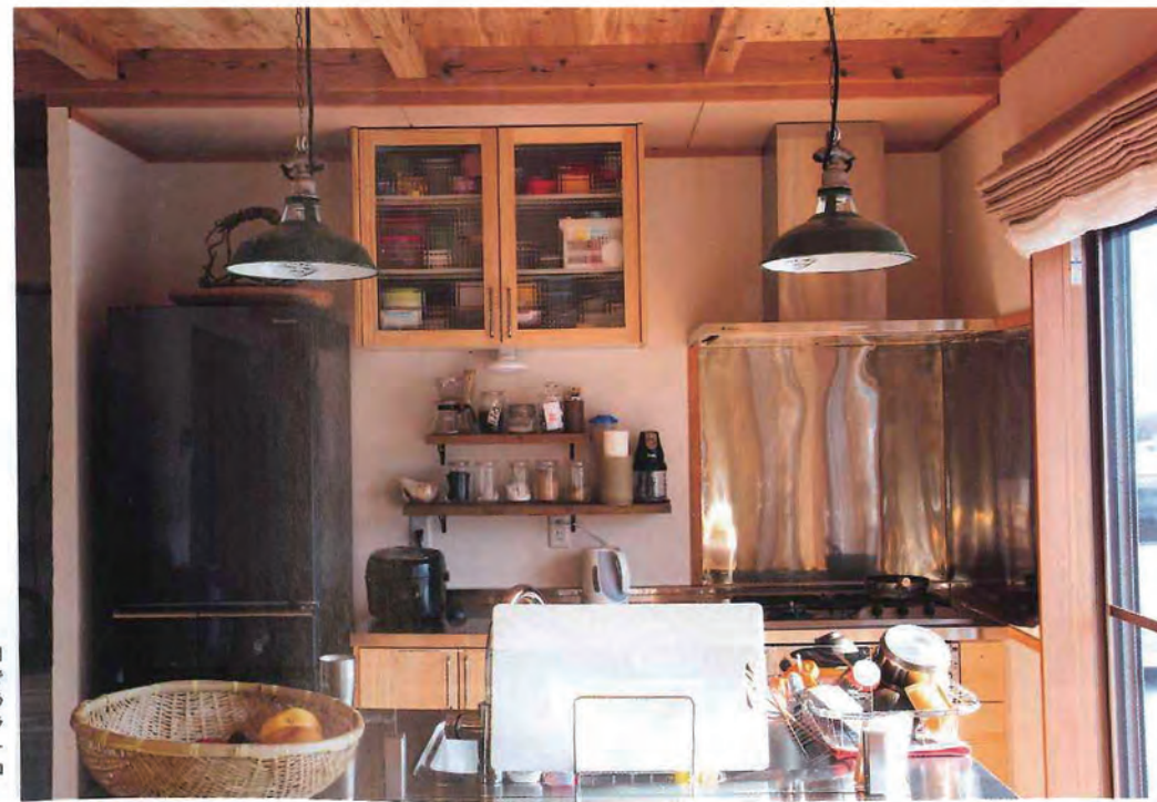
「奥さんが料理をしている間も、子どもたちが遊んでいるのを見られているように」と、設計されたアイランドキッチン。ランプシェードは現行品ながら、レトロなブリキの質感が秀逸。