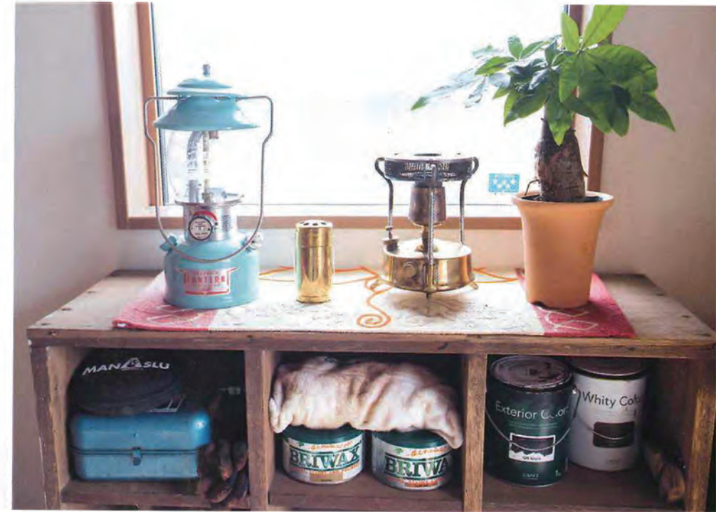
玄関横にはくコールマンのランタンやキャンプストーブなど、趣味であるアウトドアにまつわるアイテムが。ラック内にはペンキやワックスなど、D.I.Y.用のグッズを収納している。