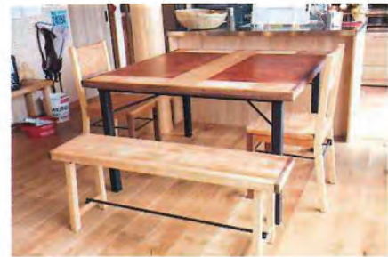
鉄脚にウッドの天板を組み合わせたダイニングテーブルもやはり「キラク」で制作されたもの。ベンチやイスもすべて同様のテイストをそろえたことで、統一感のあるすっきりとした空間に仕上がっている。