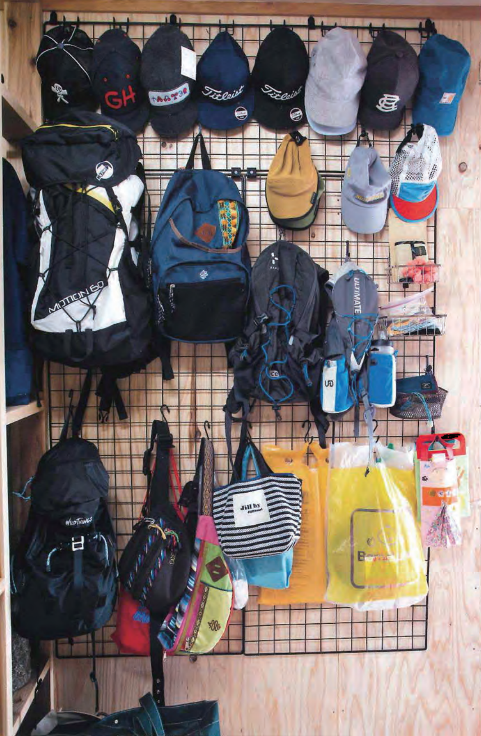
「アウトドアブランドが好きで、自然と増えていきました」というバックパックとキャップ。収納に悩んだ際、ショップのディスプレイを参考にして作ったのがこのメッシュパネルの棚。