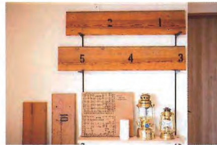
壁に飾られた木材は欧米の古材などを扱う「小山製材木材」で購入したというもので、アメリカのスタジアムでベンチボードとして使われていたもの。そのため番号入りで、倒せばそのまま棚になる仕組み。