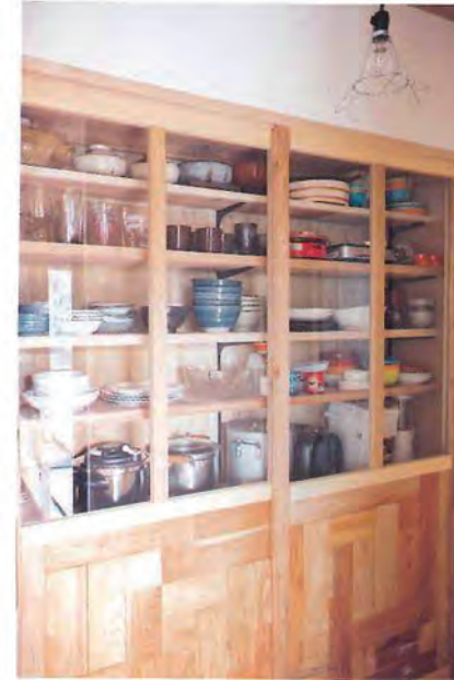
ほかの家具と同じく木製のキャブボードもくキラクにオーダーした一品。中身は7段になっていて、5人家族でも十分な収納力。食器類はすべてここに集約されている。